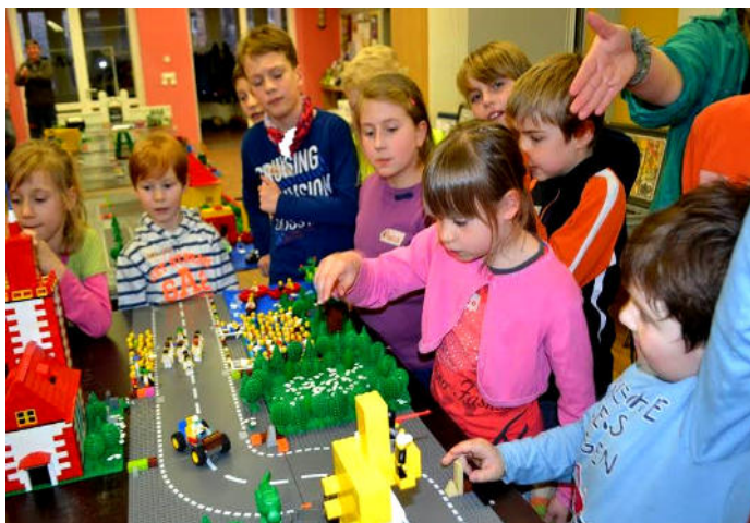
LEGO-Wochenende am 5./6. März 2016 mit Kindern der Kirchgemeinden Grimma, Colditz, Groß- bothen, Glasten und Schönbach im Kirch- gemeindehaus Grimma

„Wer hoch hinaus will, muss gut geerdet sein.“ Das erfahren die Kinder der Klassenstufen 1-6 unserer drei Gemeinden beim Kinderbibelwochenende im Pfarrgelände Großbothen unter der Überschrift „ Der Turmbau zu Babel “.