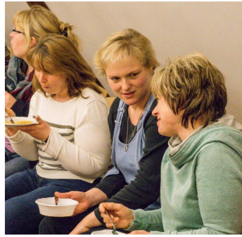
Weltgebetsstag am 4. März 2016 in der Pfarrscheune Großbothen. Partnerland war in diesem Jahr Kuba. Nach den Landesinformationen und Gebet haben wir uns mit Landestypischem gestärkt.